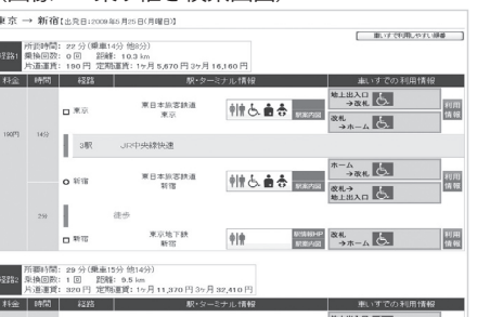
(画像2: 乗り継ぎ検索画面)